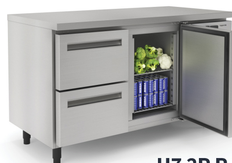
H7 2P R